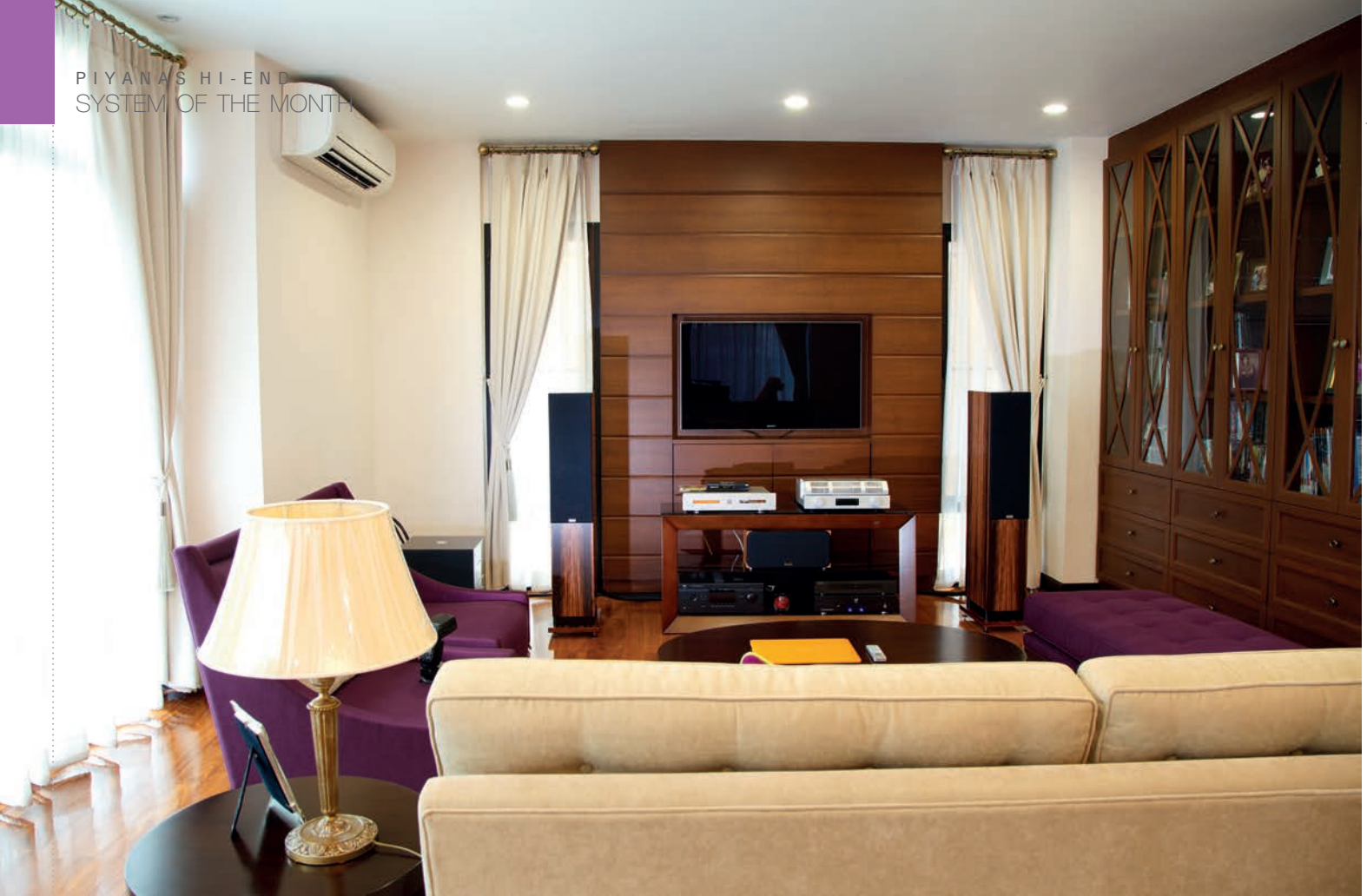
ห้องโถงรับแขก

“ การฟังเครื่องเสียงก็มักจะเป็นเวลาเลิกงาน ผมโชคดีที่ว่าผมใช้เวลาเลิกงานเดินทางกลับบ้านในเวลา หนึ่งนาทีก่อน แล้วผมก็นั่งฟังมัน แล้วไม่ได้เสียเวลาบนท้องถนน ก็มีเวลามีความสุขกับมัน ”