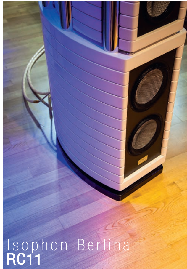
Isophon Berlina RC11

ฟังแล้วรู้สึกได้ว่าน่าปลื้มใจแม้ราคาจะสูง แต่ไม่อาจจะตัดใจขาดจากมันได้จริงๆ เหมือนทั้งความฝันและจินตนาการของตนเองลงไปเลยทีเดียว ความรู้สึกแบบนี้ไม่ได้เกิดขึ้นง่ายๆ สำหรับคนฟังเครื่องเสียงที่มีประสบการณ์ยาวนานเช่นคุณธรรมนุษย์